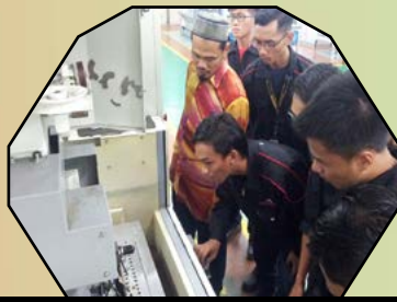
KURSUS PENINGKATAN KEMAHIRAN CNC EDM WIRECUT