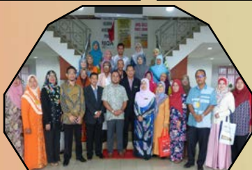
KUNJUNGAN HORMAT DELIGASI PENGURUSAN TERTINGGI FELDA WILAYAH TROLAK - 18