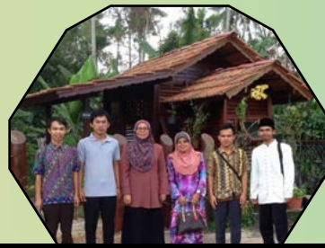
LAWATAN PELAJAR ANTARABANGSA UNIVERSITAS BENGKULU INDONESIA - 10