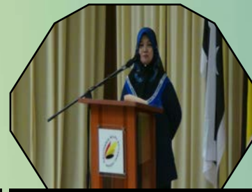
SEMINAR PERSEDIAAN MUET - 13