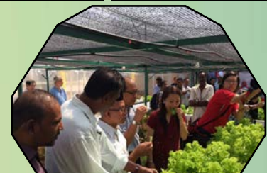
PROJEK PEMBANGUNAN & PELANCARAN KEBUN HIDROPONIK NFT MPSJ - 27