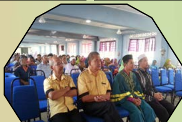
MEMPROMOSIKAN POLITEKNIK NILAI - 20