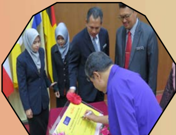
AUTHORIZE TRAINING CENTRE - 2