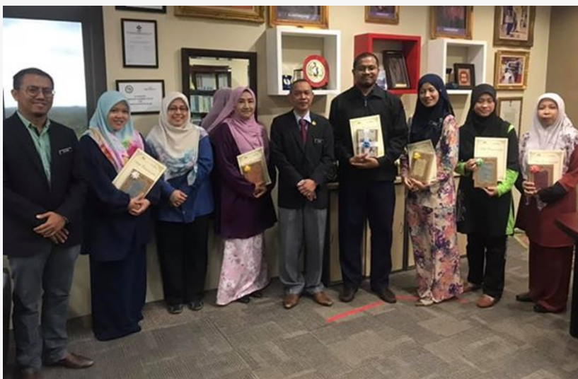
MAJLIS PENYAMPAIAN HADIAH DAN SIJIL PRO- GRAM BACAAN KEGEMA- RAN SAYA

Program telah dijalankan sepanjang tempoh Perintah Kawalan Pergerakan (PKP) bermula pada 1 hingga 14 April 2020. Program ini merupakan salah satu aktiviti bagi memartabatkan budaya membaca dalam kalangan warga Politeknik Nilai.