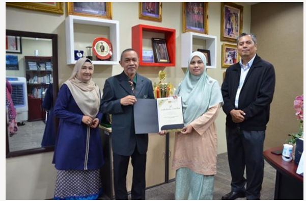
MAJLIS PENYAMPAIAN ANUGERAH PERKHIDMATAN CEMERLANG (APC) STAFF PNS 2019 DAN MAJLIS 'HI-TEA'